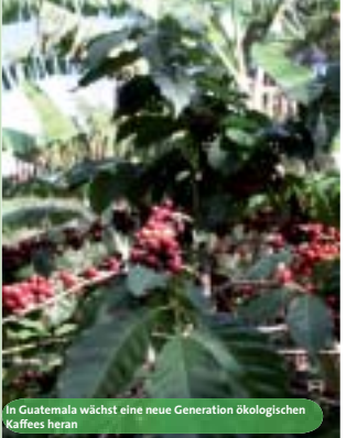
In Guatemala wächst eine neue Generation ökologischen Kaffees heran