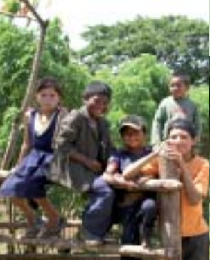
Entwicklungshilfe und Naturschutz gehen in unserem Kooperationsprojekt mit der Deutschen Welthungerhilfe Hand in Hand