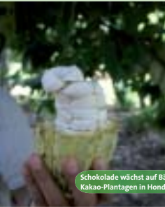
Schokolade wächst auf Bäumen, zum Beispiel in Kakao-Plantagen in Honduras