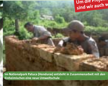
Im Nationalpark Patuca (Honduras) entsteht in Zusammenarbeit mit den Einheimischen eine neue Umweltschule