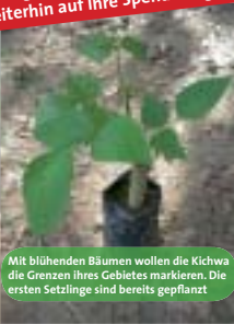
Mit blühenden Bäumen wollen die Kichwa die Grenzen ihres Gebietes markieren. Die ersten Setzlinge sind bereits gepflanzt