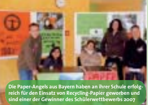
Die Paper-Angels aus Bayern haben an ihrer Schule erfolgreich für den Einsatz von Recycling-Papier geworben und sind einer der Gewinner des Schülerwettbewerbs 2007

Um die Projekte langfristig unterstützen zu können, sind wir auch weiterhin auf Ihre Spende angewiesen!