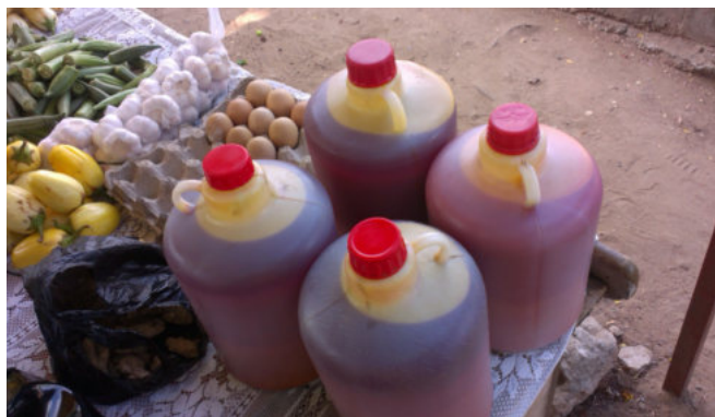
Rohes Palmöl: beliebtes Speiseöl in afrikanischer und asiatischer Küche

Die Anbauflächen für Palmöl weltweit haben sich in den vergangenen 30 Jahren fast verfünffacht. 7 Weltweit wurden im Jahr 2019 auf 28,3 Mio. Hektar Ölpalmen angebaut. 8 Das entspricht fast 80% der Fläche Deutschlands. 9 Aus den Früchten wurden 2019 weltweit 72,9 Mio. t 10 Palmöl gewonnen.