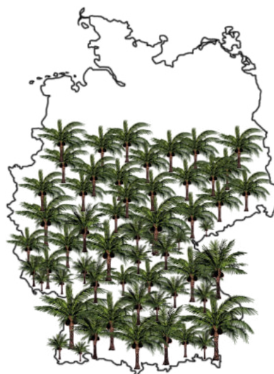
Palmölanbau weltweit: Die weltweite Anbaufläche von Ölpalmen würde zusammengenommen 80% Deutschlands bedecken.

Indonesien ist das Land, in dem es die meisten Ölpalmpflanzungen gibt und in dem auch das meiste Palmöl produziert wird: Im Jahr 2018 waren das 45 Mio. t Öl auf einer Plantagenfläche von 14,3 Mio ha. Malaysia folgte auf Platz 2 mit 21,8 Mio. t Öl. Weltweit macht die Palmölproduktion dieser beiden Länder damit 84 Prozent der Weltproduktion aus. 11 Weitere Anbaugelände für Palmöl finden sich in Afrika und Lateinamerika. Insbesondere in Nigeria und der Elfenbeinküste hat sich bereits eine weltmarktorientierte Produktion etabliert. Und auch in lateinamerikanischen Ländern wie Kolumbien, Honduras und Guatemala wächst die Fläche, die in Ölpalm-Plantagen umgewandelt wird. 12