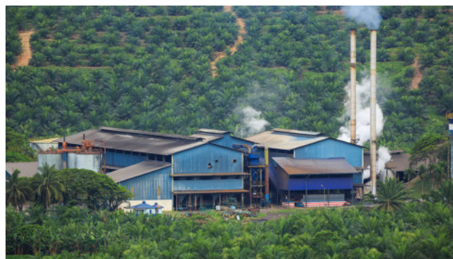
Palmölraffinerie im Bundesstaat Sabah, Malaysia

Indonesien ist das Land, in dem es die meisten Ölpalmpflanzungen gibt und in dem auch das meiste Palmöl produziert wird: Im Jahr 2018 waren das 45 Mio. t Öl auf einer Plantagenfläche von 14,3 Mio ha. Malaysia folgte auf Platz 2 mit 21,8 Mio. t Öl. Weltweit macht die Palmölproduktion dieser beiden Länder damit 84 Prozent der Weltproduktion aus. 11 Weitere Anbaugelände für Palmöl finden sich in Afrika und Lateinamerika. Insbesondere in Nigeria und der Elfenbeinküste hat sich bereits eine weltmarktorientierte Produktion etabliert. Und auch in lateinamerikanischen Ländern wie Kolumbien, Honduras und Guatemala wächst die Fläche, die in Ölpalm-Plantagen umgewandelt wird. 12