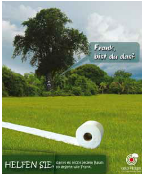
Idee von Tim Flaig für den OroVerde Plakatwettbewerb

✓ Auf der Homepage von OroVerde können Sie sich über den Recyclingpapier-Finder Bezugsquellen von Recyclingpapier anzeigen lassen und Geschäfte in Ihrer Nähe finden, die Produkte mit dem Blauen Engel führen: www.regenwald-schuetzen.org/Papier