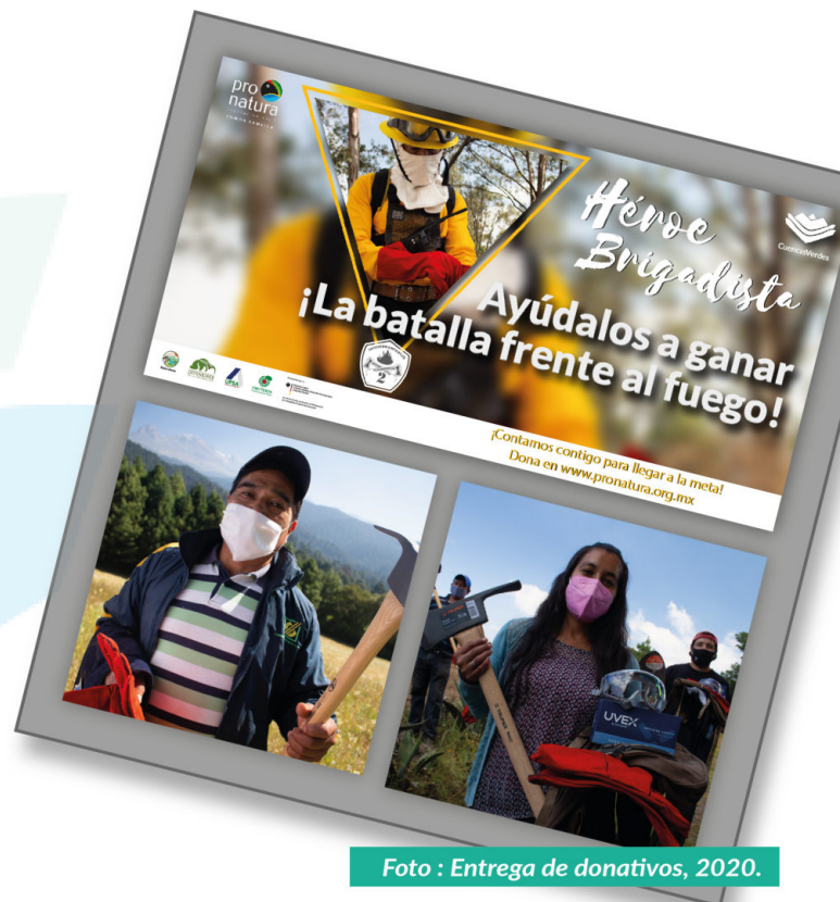
Foto : Entrega de donativos, 2020.

http://pronatura.org.mx/heroes_brigadistas.php