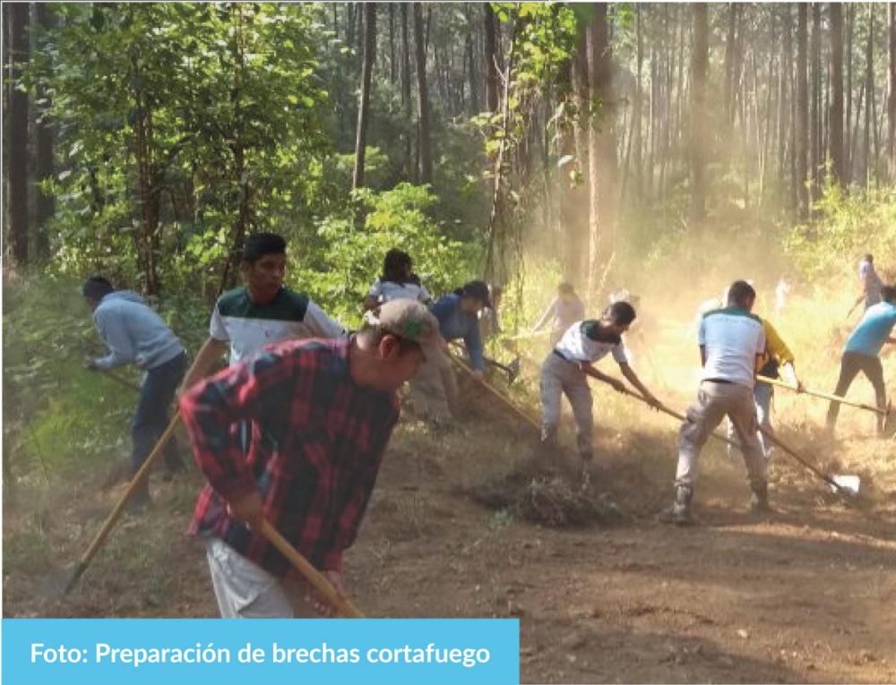
Foto: Preparación de brechas cortafuego