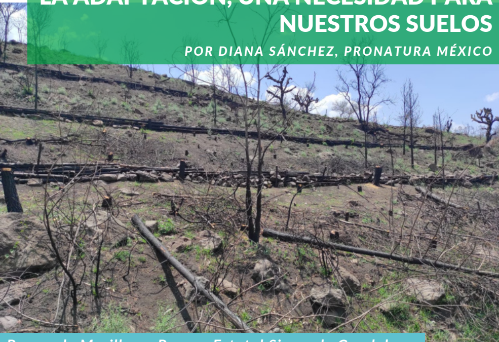
Presas de Morillo en Parque Estatal Sierra de Guadalupe

Las medidas de Adaptación basadas en Ecosistemas (AbE) aplicadas para la conservación y restauración de suelos nos ayudan a disminuir principalmente la erosión e incrementan la captación de agua.