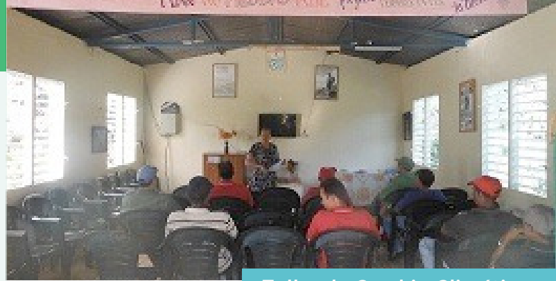
Taller de Cambio Climático

Las lecciones aprendidas en las comunidades de la cuenca del río Jaguaní han sido expuestos en eventos a nivel local, nacionales e internacionales como el VII Congreso Iberoamericano sobre Ambiente y Sustentabilidad y la Convención Internacional de medio ambiente elevando de esta forma el nivel de percepción del riesgo y conocimiento sobre el cambio climático.