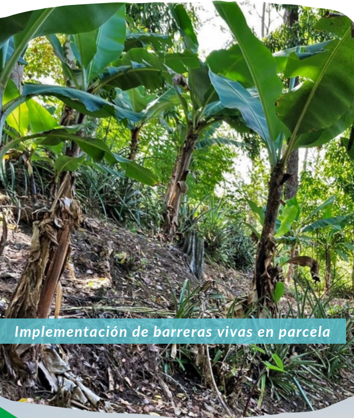
Implementación de barreras vivas en parcela