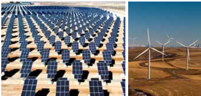
Die Energiewende hat zu einem Nachfrageboom nach speziellen Mineralien und Metallen geführt.

Cer, Germanium, Indium und Gold; 36 Kobalt ist essentiell als Elektrodenmaterial für leistungsstarke Akkus und Batterien; Tantal wird für Kondensatoren in Mobiltelefonen, Tablets, KFZ-Elektronik oder kleinen medizinischen Geräten verwendet. Auch die Herstellung von Photovoltaikanlagen ist ohne diverse Technologiemetalle nicht machbar. 37