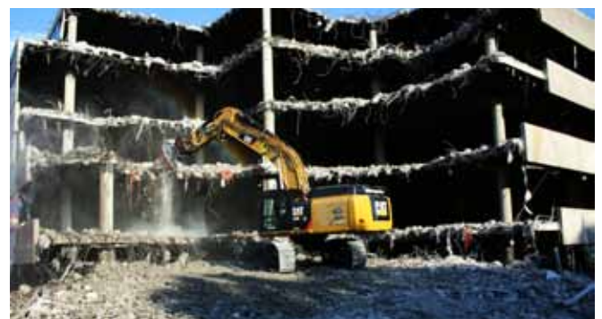
Viele in Gebäuden verarbeitete Rohstoffe können wiederverwendet werden.