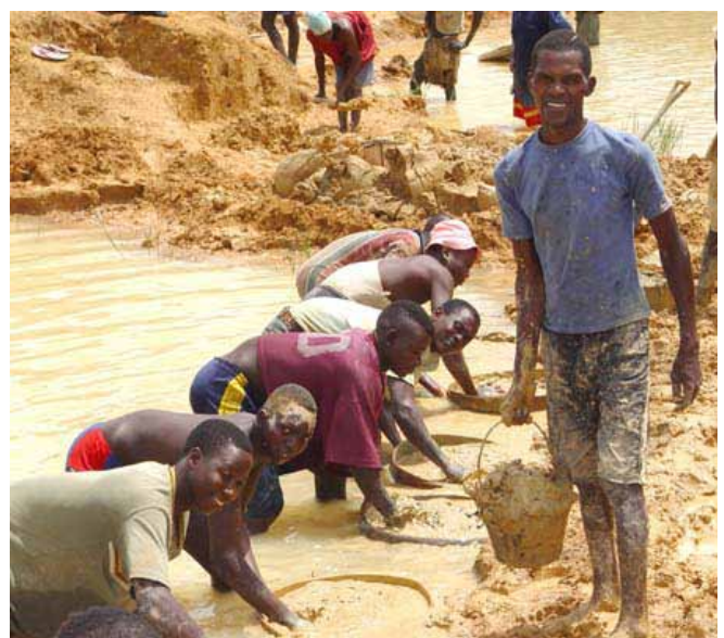
Diamantenwäsche in Sierra Leone - unter prekären Arbeitsbedingungen.

Mit dem Einzug der Bergbauaktivitäten, verändern sich auch die sozialen Strukturen vor Ort. Mittelfristige soziale Folgen sind Alkohol- und Drogenprobleme in den Bergbauregionen, Vergewaltigungen und Prostitution sowie Schulabbrüche und eine Verschiebung der Berufswahl in der jungen Generation. Traditionelle Berufe oder (Subsistenz-)Landwirtschaft sind nicht mehr interessant für junge Menschen. Gerade junge Männer wittern in den Minen das große Geld, sodass auch Schulabbrüche in der Nähe von Minen sehr häufig sind. 63 In Zentralafrika kam es in und zwischen einigen ressourcenreichen Ländern in den vergangenen Jahrzehnten zu bewaffneten Konflikten und Kriegen. Wichtige Exportprodukte wie Koltan und Tantal wurden von den Kriegsparteien aus Minen und Lagerhäusern geplündert, zum Teil außer Landes gebracht, von dort aus auf dem Weltmarkt angeboten und finanzierten so diese Kriege mit. Die hohe Korruption und schwache Regierungsführung stellen weitere Schwierigkeiten für die Länder dar, ihren Ressourcenreichtum für eine nachhaltige Entwicklung zu nutzen anstatt auf Kosten von Mensch, Tier und Umwelt. 64