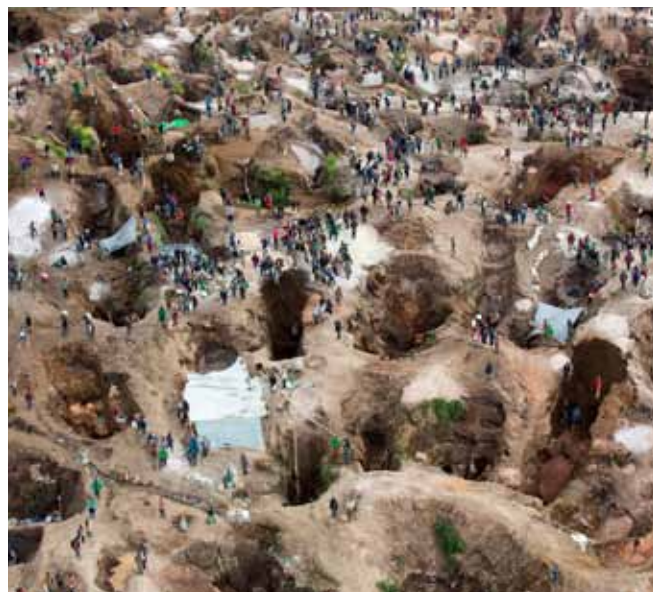
Coltan-Miene in Nord-Kivu, DR Kongo.

Tantalproduzierenden Länder. 19 Zudem ist die DR Kongo der mit Abstand wichtigste Produzent von Kobalt, da dort 50 Prozent der weltweiten Kobalt-Förderung stattfindet. 20 Ein