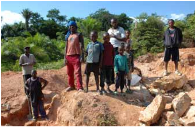
Kinderarbeit im Minengeschäft ist weit verbreitet, wie hier in Maniema, Demokratische Republik Kongo.

bis auf weiteres zerstört. Wie lange es dauert bis der Fluss und sein Mündungsgebiet im Meer sich erholen, und die Fisch- und Meeresschildkröten-Populationen sich regeneriert haben, ist unklar. Es wird von mindestens fünf Jahren bis zu mehreren Jahrzehnten gesprochen. 54