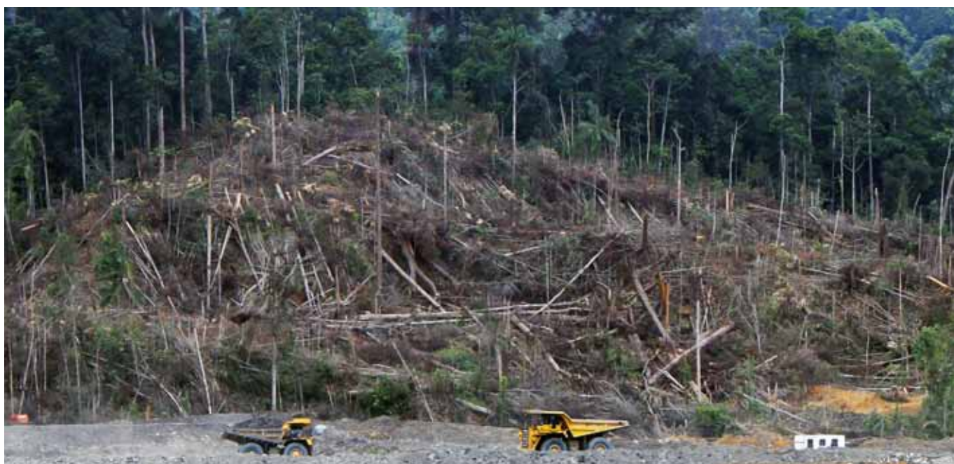
Rodungsarbeiten für eine Mine im Tropenwald von Kalimantan, Borneo.

Afrika und Asien eine größere Rolle als in Lateinamerika. 41 Da die Nachfrage vor allem in Europa, Australien und den USA weiterhin steigt, wird auch der Druck sich weiter erhöhen und die Ausbeutung voranschreiten. 42 Insgesamt werden Bergbauaktivitäten für sieben Prozent der Entwaldung in allen tropischen Wäldern verantwortlich gemacht. 43 Im brasilianischen Amazonas sind es neun Prozent. 44 Damit ist der Anteil den Bergbauaktivitäten an der Entwaldung haben, geringer als beispielsweise die Landwirtschaft in diesen Regionen, dennoch ist er nicht zu unterschätzen. In Guayana ist der Bergbau beispielsweise der hauptsächliche Entwaldungstreiber. 45 Dort hat sich die Entwaldung aufgrund von Goldschürfung zwischen 2001 und 2008 verdreifacht. Und in der peruanischen Region Madre de Dios hat die Entwaldung aufgrund von illegaler Goldschürfung von 292ha/Jahr zwischen 2003 – 2006 auf 1915ha/Jahr zwischen 2006-2009 zugenommen, was mehr als eine Versechsfachung ist. 46 Neben der Entwaldung, die vor allem im Tagebau durch die direkten Abbauaktivitäten verursacht wird, entsteht ein unterschätzter Teil der Entwaldung durch die ihm zugerechnete Infrastruktur wie Straßen und Siedlungen. 47 So konnte eine Studie im brasilianischen Amazonasgebiet zeigen, dass die entwaldete Fläche in einem Radius von 70 km rund um eine Mine zwölfmal größer war, als die Entwaldung, die nur durch die unmittelbaren Abbauaktivitäten entstanden ist. Wald wird abgeholzt, um den Zugang zum Abbaubereich