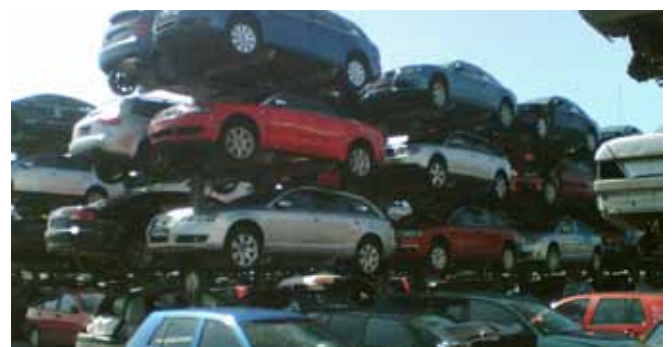
Fahrzeugrecycling auf dem Schrottplatz.