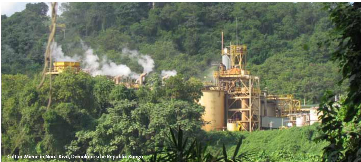
Coltan-Miene in Nord-Kivu, Demokratische Republik Kongo

Die Exporte mineralischer Ressourcen sind gerade für afrikanische Länder wie die DR Kongo wirtschaftlich von hoher Bedeutung. Auch wenn die Mineralien mengenmäßig auf dem globalen Markt nur eine untergeordnete Rolle spielen, stellen sie einen Großteil des BIP bzw. einen Großteil aller Exporte des einzelnen Landes dar; in der DR Kongo beispielsweise drei Viertel des BIP 21 und 95 Prozent der Exporte. 22 Womit das Land sehr abhängig ist von diesen Exportprodukten. In vielen afrikanischen Ländern hat die Produktion von mineralischen Rohstoffen eine ähnlich große Bedeutung für die nationale Gesamtwirtschaft. 23