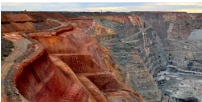
Für die Gewinnung von Rohstoffen im Tagebau werden gewaltige Mengen an Erdreich bewegt.

Der Tagebau ist die massivste Form der umweltzerstörerischen Bergbaumethoden. Die Mengen von taubem Gestein (d.h. das Erdreich/Gesteinsmaterial, das bei der Gewinnung und Schaffung des Zugangs zu mineralischen Ressourcen bewegt und nach Entnahme der Rohstoffe nicht weiter genutzt wird) variieren zwischen den verschiedenen Erzen und Metallen erheblich. So entsteht bei der Gewinnung einer Tonne reinen Eisens ca. eine Tonne taubes Gestein. Bei der Gewinnung von einer Tonne Kupfer sind es bis zu 200 Tonnen Erde, die bewegt werden. 49 Und nur für die Menge Gold um einen Ring herzustellen (circa fünf Gramm), entstehen 20 Tonnen