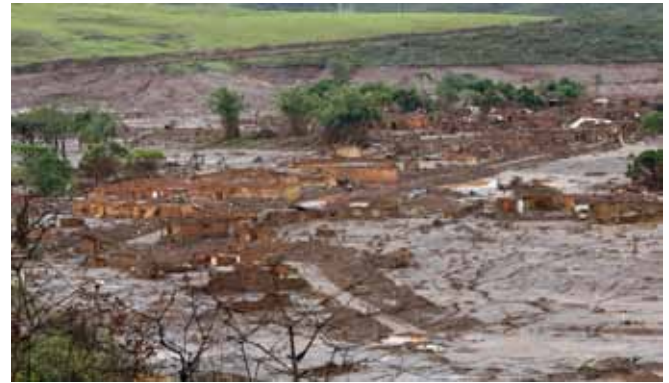
In den Abbaugeländen kommt es immer wieder zu Katastrophen, wie 2015 bei einem Dammbrech im Eisenerztagebau in Bento Rodrigues, Brasilien.

Abfall-Gestein. 50 Beim Tagebau-Abbau von Gold, das sowohl in Flussbetten, als auch im Uferbereich vorkommt, werden ganze Ufergebiete gesprengt. So kommt es zu einer starken Erhöhung von aufgewirbelten Erdpartikeln im Wasser und Schlamm-Bildung und somit zu einem ge- bzw. zerstörten Ökosystem auch viele Kilometer flussabwärts. 51 Aufgrund der weltweit hohen Nachfrage und erster sich erschöpfender Lagerstätten, die leicht zugänglich waren, werden immer weniger ertragreiche Lagerstätten in Nutzung