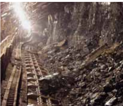
Stollen eines Untertagebaus für Kohle.

Tagebau: Liegen die Rohstoffvorkommen an oder nahe der Erdoberfläche erfolgt der Abbau im Tagebau, wie in einem Steinbruch. Bauxit ist ein Erz das vorwiegend im Tagebau abgebaut wird.