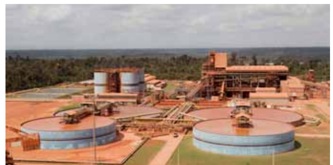
Schlammbecken einer Bauxitmine in Brasilien.

Bei unterschiedlichen Methoden zur Gewinnung der Mineralien und Metalle kommen verschiedene, auch giftige Substanzen, Schwermetalle und Chemikalien wie Blei, Cyanid und Quecksilber zum Einsatz, die in Luft, Wasser und Boden eingetragen werden. Schätzungsweise ein Drittel des Weltverbrauchs an Quecksilber wird für illegale Goldschürfstellen an Flüssen im Amazonasgebiet genutzt. Pro Jahr werden dort mehr als 100 t Quecksilber eingesetzt. 52 Bei der Verarbeitung entstehen giftige Quecksilbergase und das Quecksilber gelangt ebenfalls in Grund- und Flusswasser und lagert sich so über die Nahrungskette in Pflanzen, Tieren und letztlich dem Menschen an. Zudem entstehen – nicht nur beim Goldabbau – große Mengen belastetes Wasser oder Schlamm, der in großen Becken gesammelt werden muss. Es kommt immer wieder zu Lecks oder gar Dammbrechen dieser Becken und das giftige Wasser bzw. der Schlamm fließt in die Umwelt. 53 Ein jüngstes Beispiel dieser Gefahr