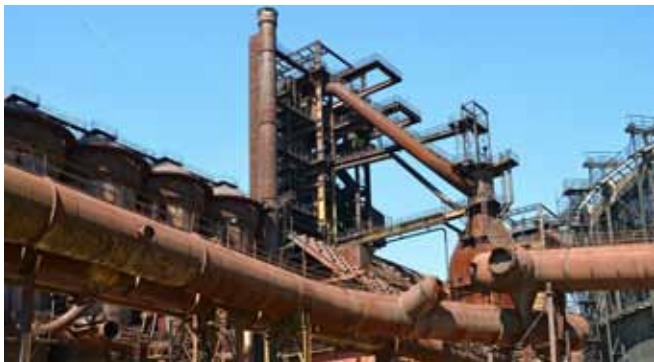
Die meisten metallischen Rohstoffe sind in Häusern, Gebäuden und Infrastrukturen verarbeitet.

Die Energiewende und der damit einhergehende Ausbau sowie die Nutzung erneuerbarer Energien, haben zu einem Nachfrageboom nach speziellen Mineralien und Metallen geführt. Solche sogenannten Technologierohstoffe sind häufig nur in sehr kleinen Mengen nötig, jedoch besitzen sie besondere Eigenschaften, die für viele neue technische Lösungen unverzichtbar sind. Dazu gehören seltene Erden und Edel- und Sondermetalle wie Tantal/Coltan, Neodym, Gallium oder Indium, aber auch Silber, Gold und Platin. 35 LEDs bestehen beispielsweise aus mehr als zehn verschiedenen Metallen, z.B.