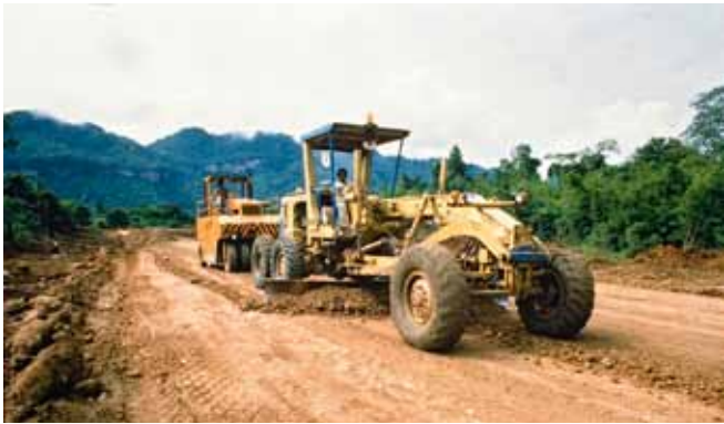
Straßenbau in Brasilien, um den Zugang zum Abbaugelände überhaupt zu ermöglichen.

überhaupt zu erschließen, um Infrastruktur um die Abbaustelle herum anzulegen, um Wohnmöglichkeiten, Ackerfläche und Brennholz für die Arbeiter zu schaffen und Straßen oder Schienen zu bauen, um Menschen hin und her und die Rohstoffe letztlich abzutransportieren. Auch Weiterverarbeitungs-Industrie siedelt sich in der näheren Umgebung an. Insgesamt wird dadurch ein weiteres Eindringen des Menschen in neue, bisher unerschlossene Waldgebiete ermöglicht. 48