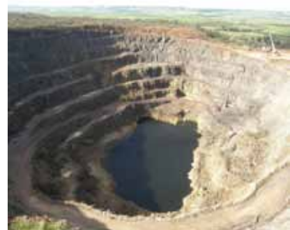
Kupfertagebau Kanmantoo, Australien.

Weiterhin wird unterschieden zwischen Kleinbergbau , oder artesisanalem Bergbau, bei dem ohne oder mit sehr einfachen mechanischen Methoden gearbeitet wird, und industriellem Bergbau mit großen Maschinen und hoher technischer Unterstützung.