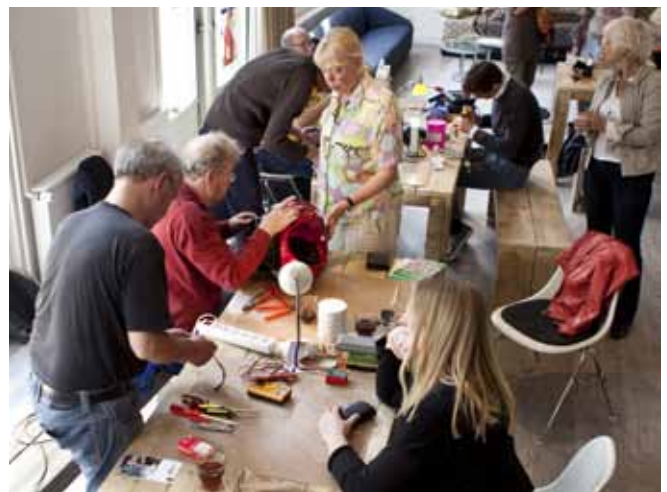
In Repair-Cafés gibt es kostenlos Hilfe zur Selbsthilfe. Alles was defekt ist, wird, wo möglich, repariert.