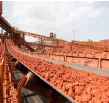
Förderanlage Bauxit, Brasilien.

Bodenschätze oder Mineralische Ressourcen/Rohstoffe sind beides Oberbegriffe für Erze und Metalle, fossile Rohstoffe wie Kohle und Erdöl/-gas sowie Steine und Erden. Teilweise werden die fossilen Rohstoffe aus den Oberbegriffen auch ausgeklammert; so auch in diesem Positionspapier.