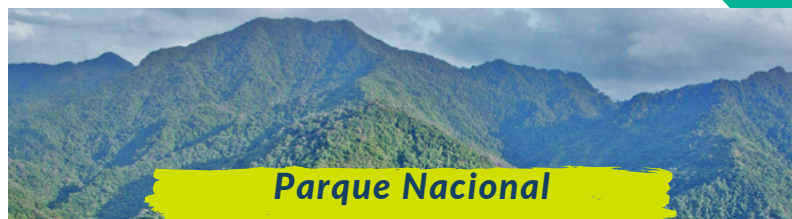
Parque Nacional Alejandro de Humboldt